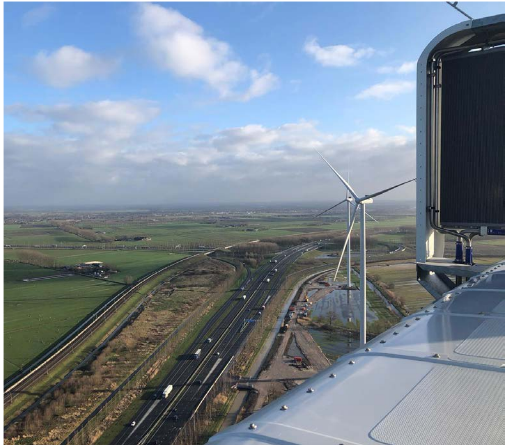
Een impressie van de reeds geïnstalleerde turbines op het zeer drassige terrein van Staatsbosbeheer.

Er is gekozen voor een stabilisatie van de ondergrond door middel van Enviro-Mat